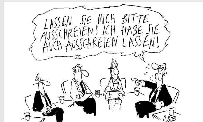
hauck & bauer